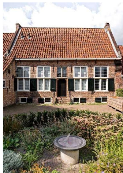
Hofje De Armen de Poth te Amersfoort.