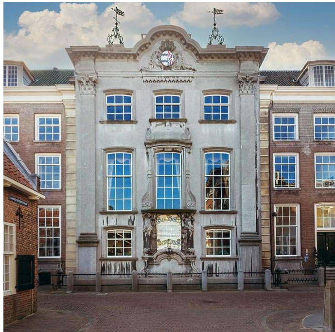
Fundatie van Renswoude

Voor de liefhebbers begint de excursie met een lunch voor eigen rekening; anderen kunnen vanaf 12.45 verzamelen voor de ingang van het Centraal Museum, Agnietenstraat 1, 3512 XA Utrecht.