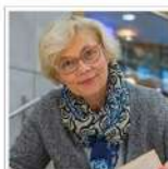
Vele wegen leiden naar het motorschip Oranje Micha Cluysenaar