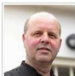
De Ruïne van Brederode Jeroen Verhoog