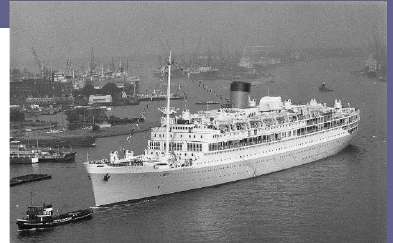
MS Oranje vertrekt voor 2 cruises uit Amsterdam, 21 juli 1960

Het voelt direct als een uitdaging. Steeds weer die Oranje. Ik zie mijn moeder voor me. Als achtjarig meisje was ze aan de hand van haar ouders aanwezig bij de tewaterlating en de doop van het schip door koningin Wilhelmina in 1938 in Amsterdam. Het paradepaardje van de Stoomvaart Maatschappij 'Nederland' (SMN) was bestemd voor de lijndienst Amsterdam-Batavia. Ik denk aan verhalen van cliënten van Stichting Pelita, waar ik ooit werkte, die na de oorlog ziek en verzwakt uit de interneringskampen kwamen en daarom als een van de eersten eind 1945 met de Oranje naar Nederland mochten repatriëren; voor hen was dat het begin van een nieuw leven. Het vlaggenschip was tijdens de oorlog omgebouwd tot geallieerd hospitaalschip en dus uitstekend geëquipeerd voor het transport van zieke evacués.