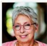
Voorwoord Dolly Verhoeven