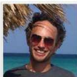
Brandend water in de haven van Delfzijl Thomas Drescher